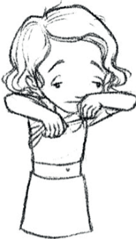
Quitarse la ropa (Yo) me quito la ropa