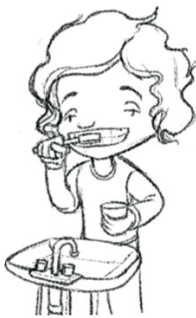
Cepillarse los dientes (Yo) me cepillo los dientes