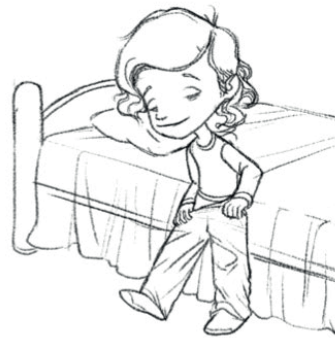
Ponerse el pijama (Yo) me pongo el pijama