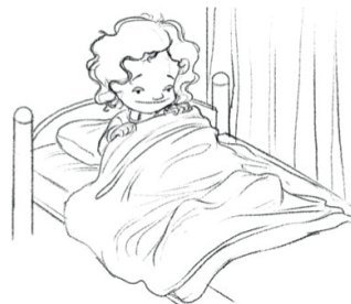
irse a la cama (Yo) me voy a la cama