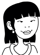
tía [esposa de mi tío]