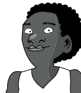
tío [esposo de mi tía]